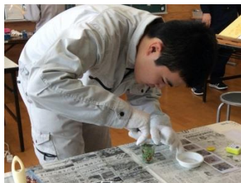
飾りの花を入れています。