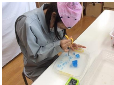
ろうを細かく刻んでいます。