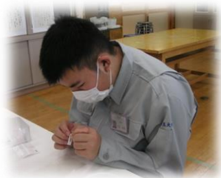
香い袋に値札を貼っています