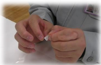
値札が小さいんですよ