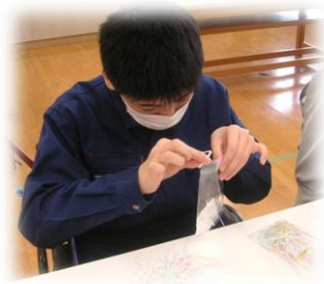
ラッピングしています。