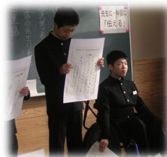
ハーフ加工班より