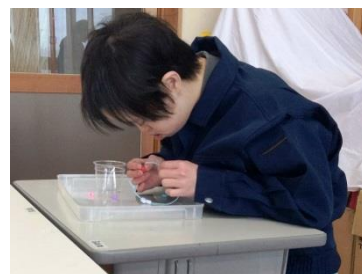
ラッピング用にビーズ通しをしています。