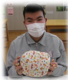
おひるねまくらもどうぞ！ 400円です。

<農園芸班> 白神の自然をイメージした「フラワーキャンドル」とブナの実や葉を使ったスワッグの製作をしています。農場で育てた「ポップコーン」の計量と仕分けの作業も行っています。