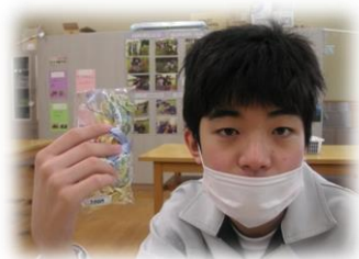
これが香い袋です。100円になります。