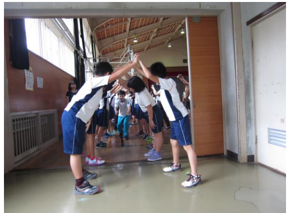
みんなに見守られて自分からアーチをくぐる