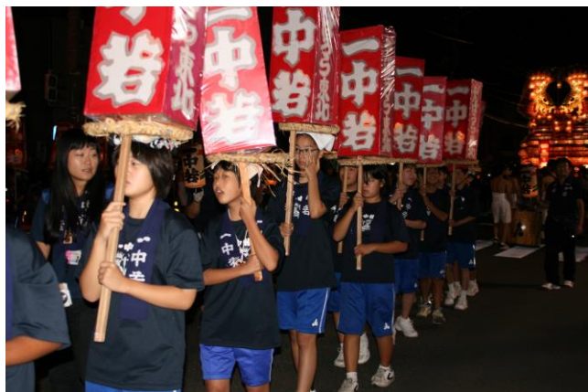
仲間と祭りを盛り上げました。わっしょい！！