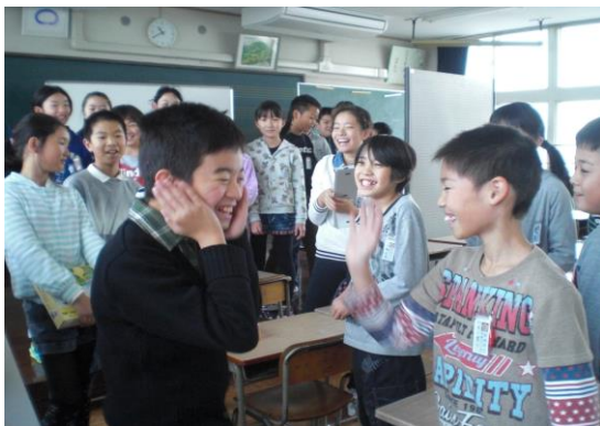
久しぶりに会った友達とハイタッチ